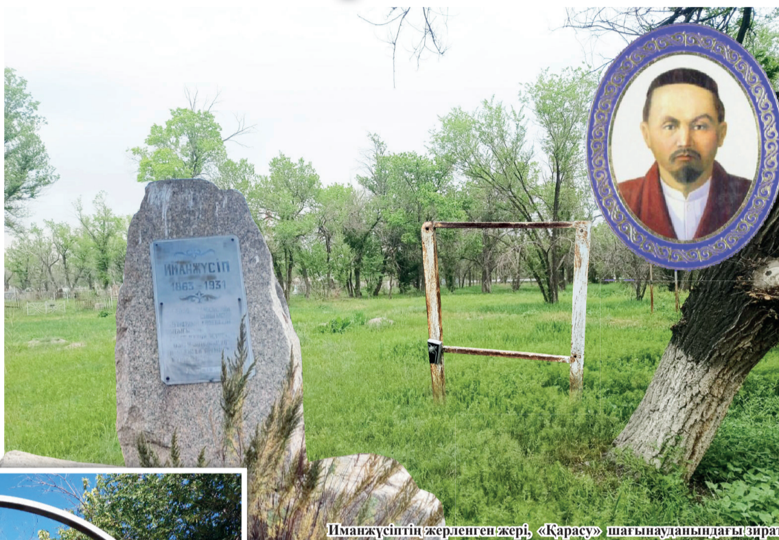
Иманжүсіптің жерленген жері, «Қарасу» шағынауданындағы зират